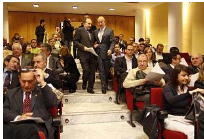
Acto de la presentación del estudio del tren Ruta de la Plata, ayer en la Cámara de Comercio de Salamanca.